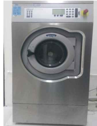
James H. Heal marka FOM 71 CLS model yıkma sonrası boyut değişimi test cihazı.

Lif, iplik ve kumaş yapılarının mikroskobik görsel inceleme uygulamalarında kullanılmaktadır.