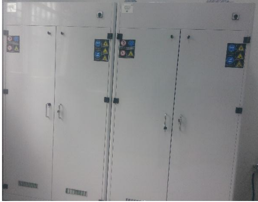
Kimyasal malzeme dolapları.

Tekstil ürünlerinde renklerinin yıkama ve kuru temizleme gibi işlemlerde oluşacak solmaya ve bu renklerin diğer kumaşlara akmasına karşı dirençlerin tespit edilmesi amacıyla kullanılmaktadır.