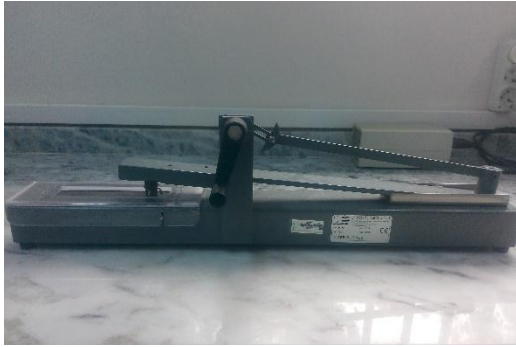
James H. Heal marka sürtme haslığı test cihazı (Crockmeter).

Özellikle örgü kumaşlarda olmak üzere birçok kumaş türünde diz, dirsek vb. bölgelerde oluşan zorlama etkisinin, patlama direnci esaslı ile test edilmesi için kullanılmaktadır.