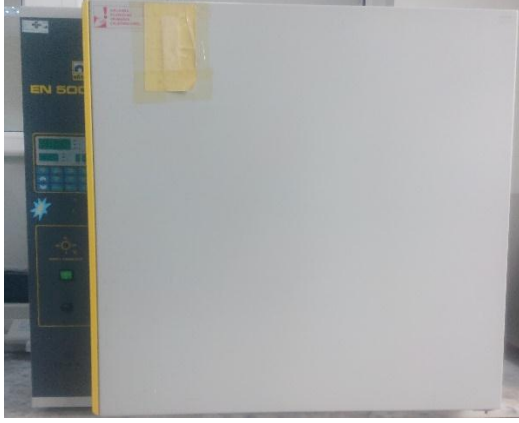
Nüve marka EN 500 model inkübatör tipi etüv.

Ter, su, deniz suyuna karşı renk haslıkları vb. kapalı ortamda yapılması gereken haslık testlerinde, tekstil ürünlerinin renklerinde olacak solma ve diğer kumaşlara akmanın tespit edilmesi amacıyla kullanılır.