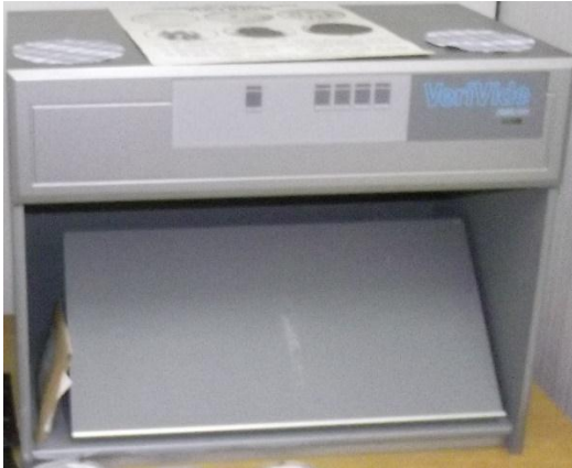
Verivide marka CAC 60 model ışıklı renk değerlendirme kabini.

Tekstil ürünlerinin deneysel amaçlı olarak tüpler içerisinde, kapalı ortamda küçük miktarlarda boyanması amacıyla kullanılmaktadır.