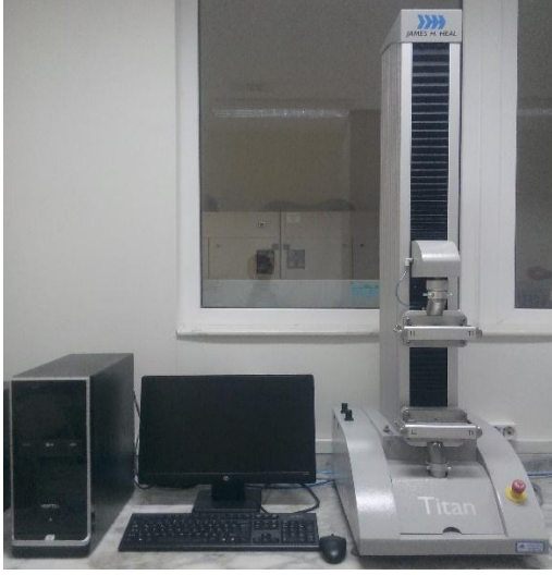
James H. Heal marka Titan model Universal mukavemet test cihazı.

Çene aparatları değiştirilerek ipliklerde kopma mukavemeti, kumaşlarda kopma, yırtılma, dikiş mukavemeti, dikiş kayması vb. germe-çekme esasına dayalı birçok mukavemet testi yapılmaktadır.