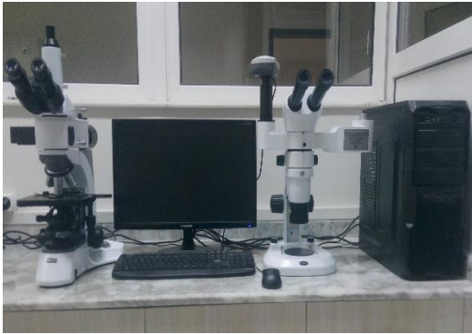
Novel marka N-800M model kameralı ışık mikroskobu ve Novel marka NSZ 808 model stereo mikroskop.

Giysilik, döşemelik vb. birçok kumaş türüne numune tutucu ve ağırlıkların değişimi ile aşınma dayanımı ve boncuklanma direnci testleri yapılmaktadır.