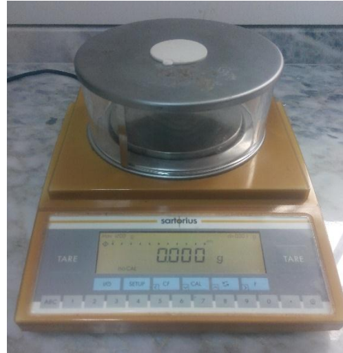
Sartorius marka gramaj terazisi.

Kumaş boyalarının sürtünme sonucunda oluşan solmaya karşı dirençlerinin tespiti amacıyla kullanılmaktadır.