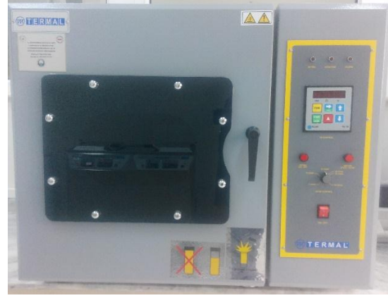
Termal marka A42925 ECO IR model infrared numune boyama cihazı.

Ter, su, deniz suyuna karşı renk haslıkları vb. kapalı ortamda yapılması gereken haslık testlerinde, tekstil ürünlerinin renklerinde olacak solma ve diğer kumaşlara akmanın tespit edilmesi amacıyla kullanılır.