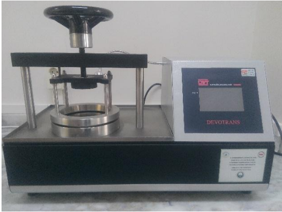
Devotrans marka SG T DLC model su geçirmezlik test cihazı.

Ortam nem ve sıcaklığının farklı ölçüm sistemleri ile ölçülmesi ve özel kağıt üzerine kayıt edilmesi amacıyla kullanılmaktadır.