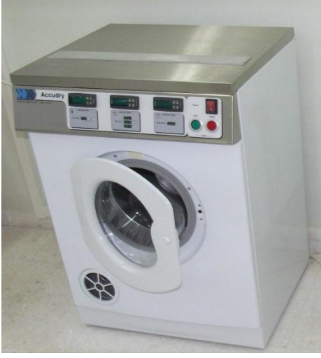
James H. Heal marka Accudry model laboratuvar tipi tamburlu kurutucu.

Standartlarda belirtilen kurutma metodu tamburlu kurutma olduğunda, boyut değişimi tespiti vb. amaçlarla yıkanmış olan kumaşların kurutulması amacıyla kullanılır. Farklı süre ve sıcaklıklara ayarlanabilir özelliktedir.