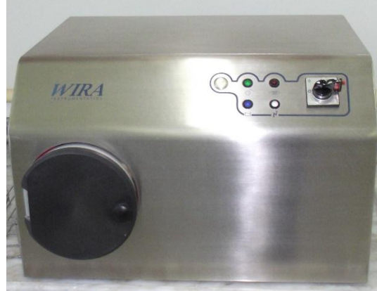
Wira marka buhar silindiri.

Testil test ve analizlerinde kullanılan kimyasal maddelerden ortama buhar salınımını ve olası yangınların kimyasallara ulaşmasını engellemek amacıyla kullanılmaktadır.