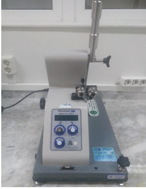
James H. Heal marka Elmatear model yırtılma mukavemeti test cihazı.

Dokuma kumaşlarda balistik sarkaç metodu ile yırtılma mukavemeti testi yapılmaktadır. Anlık yırtılmaların örneklenmesi açısından daha avantajlıdır.