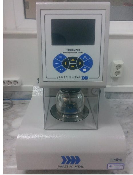
James H. Heal marka, TruBurst model patlama dayanımı test cihazı.

Dokuma kumaşlarda balistik sarkaç metodu ile yırtılma mukavemeti testi yapılmaktadır. Anlık yırtılmaların örneklenmesi açısından daha avantajlıdır.