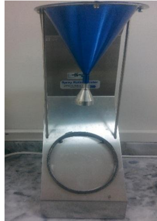
James H. Heal marka su iticilik seviyesi test ekipmanı.

Su geçirmezlik özelliği olan kaplanmış vb. kumaşların artan su basıncına karşı dayanacağı basınç seviyesi ya da belli bir basınca karşı dayanacağı sürenin belirlenmesi amacıyla kullanılmaktadır.