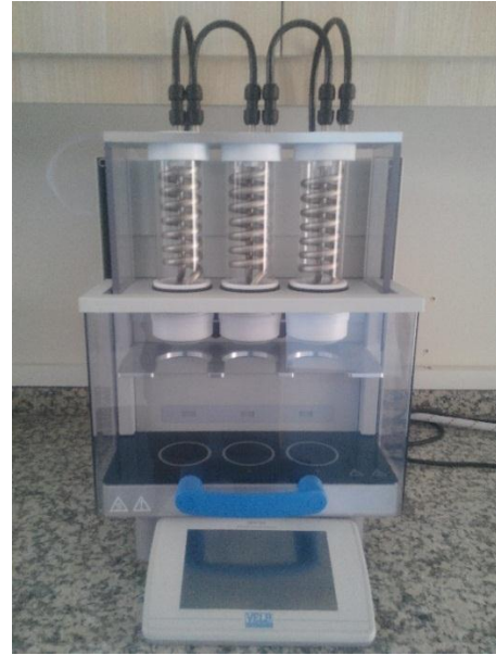
Velp marka SER 158/3 model sıcak ekstraksiyon cihazı.

Tekstil ürünlerinin renklerinin kıyaslanması ve özellikle haslık testleri sonucunda oluşan akma ve solma derecelerinin skala ile kıyaslanarak değerlendirilmesi amacıyla kullanılmaktadır.