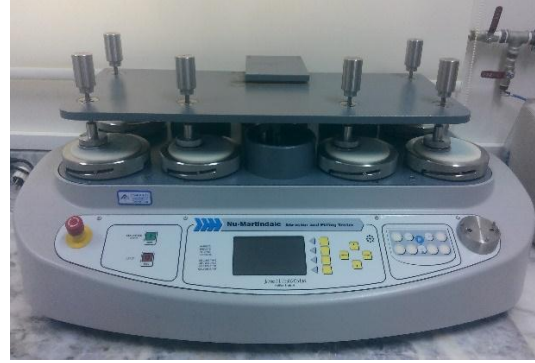
James H. Heal marka, Nu-Martindale model aşınma ve boncuklanma test cihazı.

Çene aparatları değiştirilerek ipliklerde kopma mukavemeti, kumaşlarda kopma, yırtılma, dikiş mukavemeti, dikiş kayması vb. germe-çekme esasına dayalı birçok mukavemet testi yapılmaktadır.