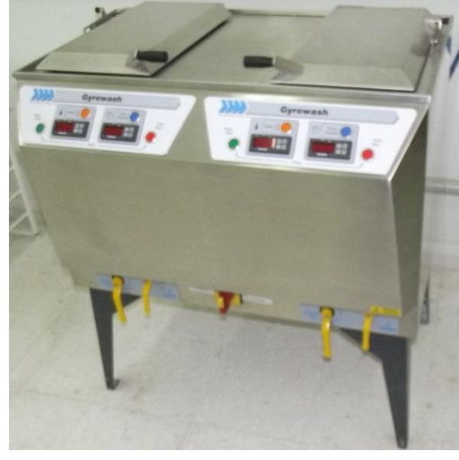
James H. Heal marka Gyrowash model yıkama, kuru temizleme renk haslıkları test cihazı.

Standartlarda belirtilen kurutma metodu tamburlu kurutma olduğunda, boyut değişimi tespiti vb. amaçlarla yıkanmış olan kumaşların kurutulması amacıyla kullanılır. Farklı süre ve sıcaklıklara ayarlanabilir özelliktedir.