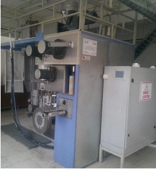
Laboratuvar tipi eriyikten lif çekim makinesi.

Ağızlık açma sistemi armürlü, atkı atma sistemi kancalı olan sanayi tipi dokuma makinesi olup eğitim amaçlı kullanılmaktadır.