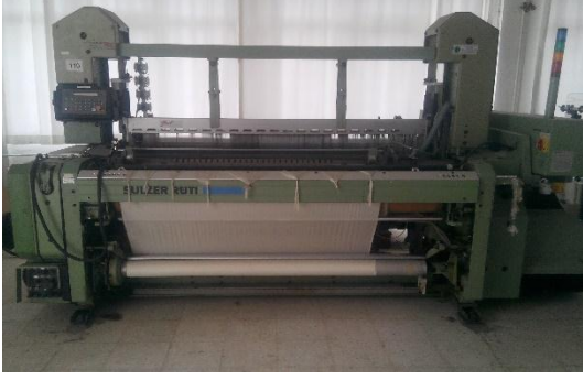
Sulzer Ruti marka L5100 model dokuma makinesi.

Ağızlık açma sistemi armürlü, atkı atma sistemi hava jetli olan sanayi tipi dokuma makinesi olup eğitim amaçlı kullanılmaktadır.