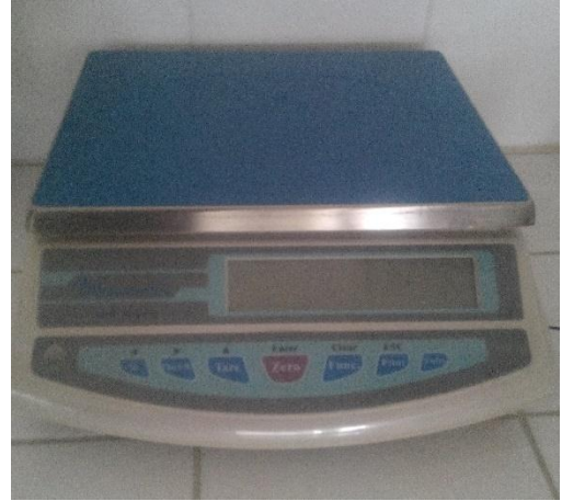
Dikomsan marka JS-B model terazi.

Proje kapsamında özgün olarak üretilmiş makine olup kalın numaralarda eriyikten çekim lif üretimi amacıyla kullanılmaktadır.