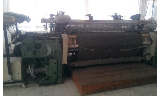
Picanol marka GTX model dokuma makinesi.

Ağızlık açma sistemi armürlü, atkı atma sistemi hava jetli olan sanayi tipi dokuma makinesi olup eğitim amaçlı kullanılmaktadır.