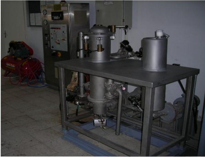
Bobin boyama ve santrifüj kurutma cihazları