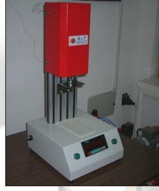
Stiffness Yumuşaklık Test Cihazı