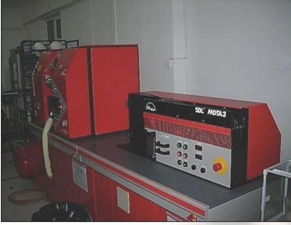
Quickspin OE-Rotor İplik Eğirme Makinesi