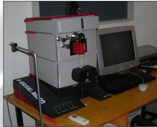
Uster Tester 4SX Düğünlük Test Cihazı