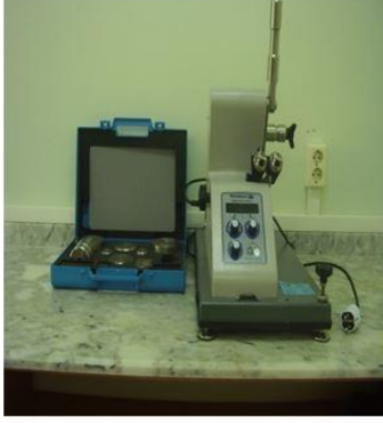
Yırtılma Mukavemeti Test Cihazı