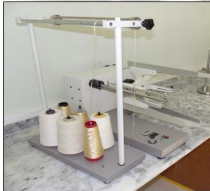
Metrik Numara Çıkrığı