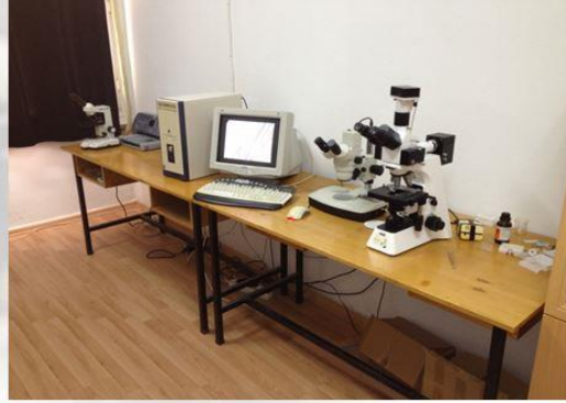
Görüntü Analizleri için Mikroskop ve Makroskop'lar