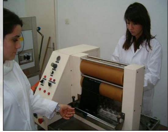
Açık En Numune Boyama Cihazı