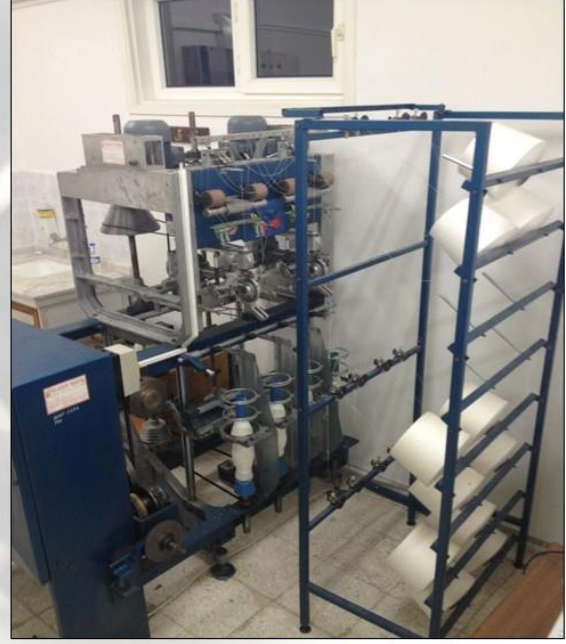
Sönil İplik Üretim Makinesi