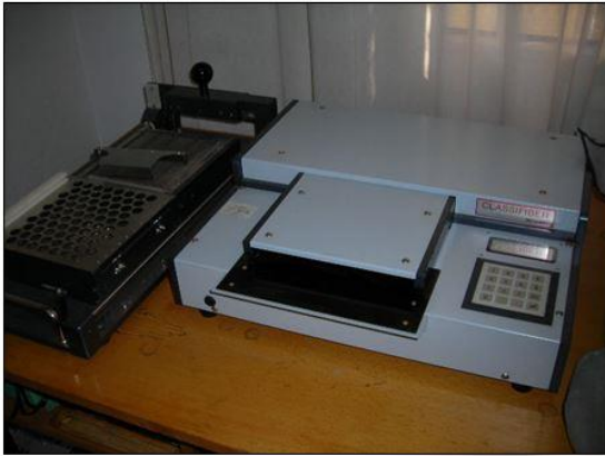
Classifiber Lif Uzunluk Test Cihazı