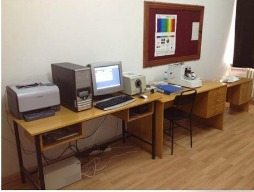
Spektrofotometre ve Rotary Mikrotom Cihazı