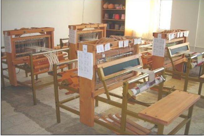
Desen Tasarım Atölyesi