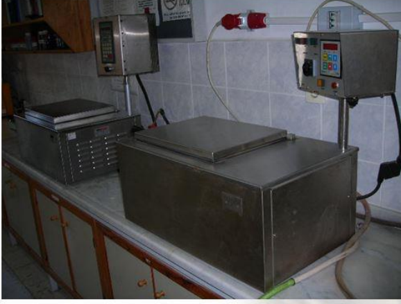
Numune Boyama ve Yıkama Cihazları