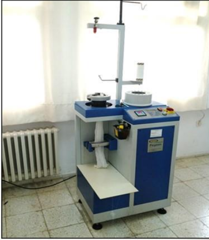
Numune Örne Makineleri