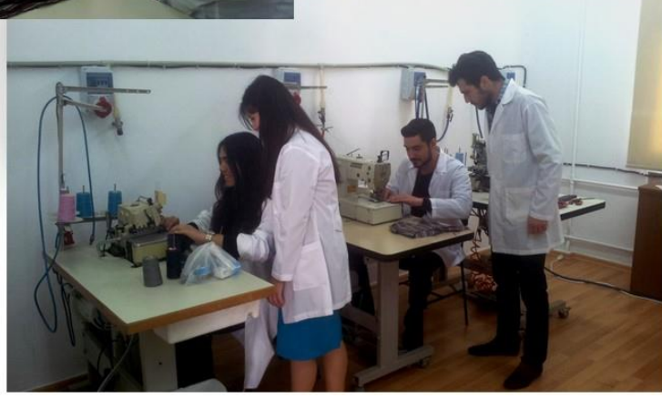
Konfeksiyon Uygulama Altyapısı